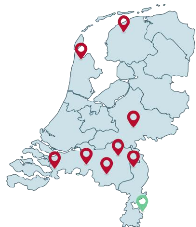
Figuur 1: Kaart locaties Commissies Overleg & Voorlichting Milieu

Anno 2024 zijn er in totaal acht COVM's actief (zie figuur 1), elk voor een militaire basis: vliegbasis Delen, Maritiem Vliegveld De Kooy, Vliegbasis De Peel, Vliegbasis Eindhoven, Gilze-Rijen, Luchthaven Leeuwarden, Vliegbasis Volkel, Vliegbasis Woensdrecht en er is één Commissie AWACS Limburg (CAL) actief voor de NAVO-vliegbasis Geilenkirchen (in groen weergegeven).