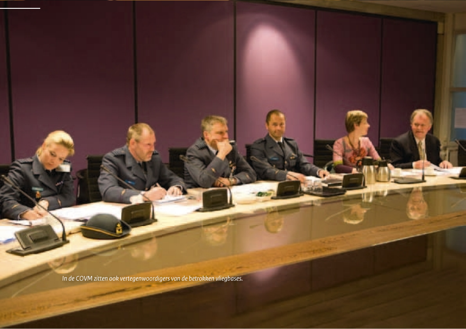
In de COVM zitten ook vertegenwoordigers van de betrokken vliegbases.