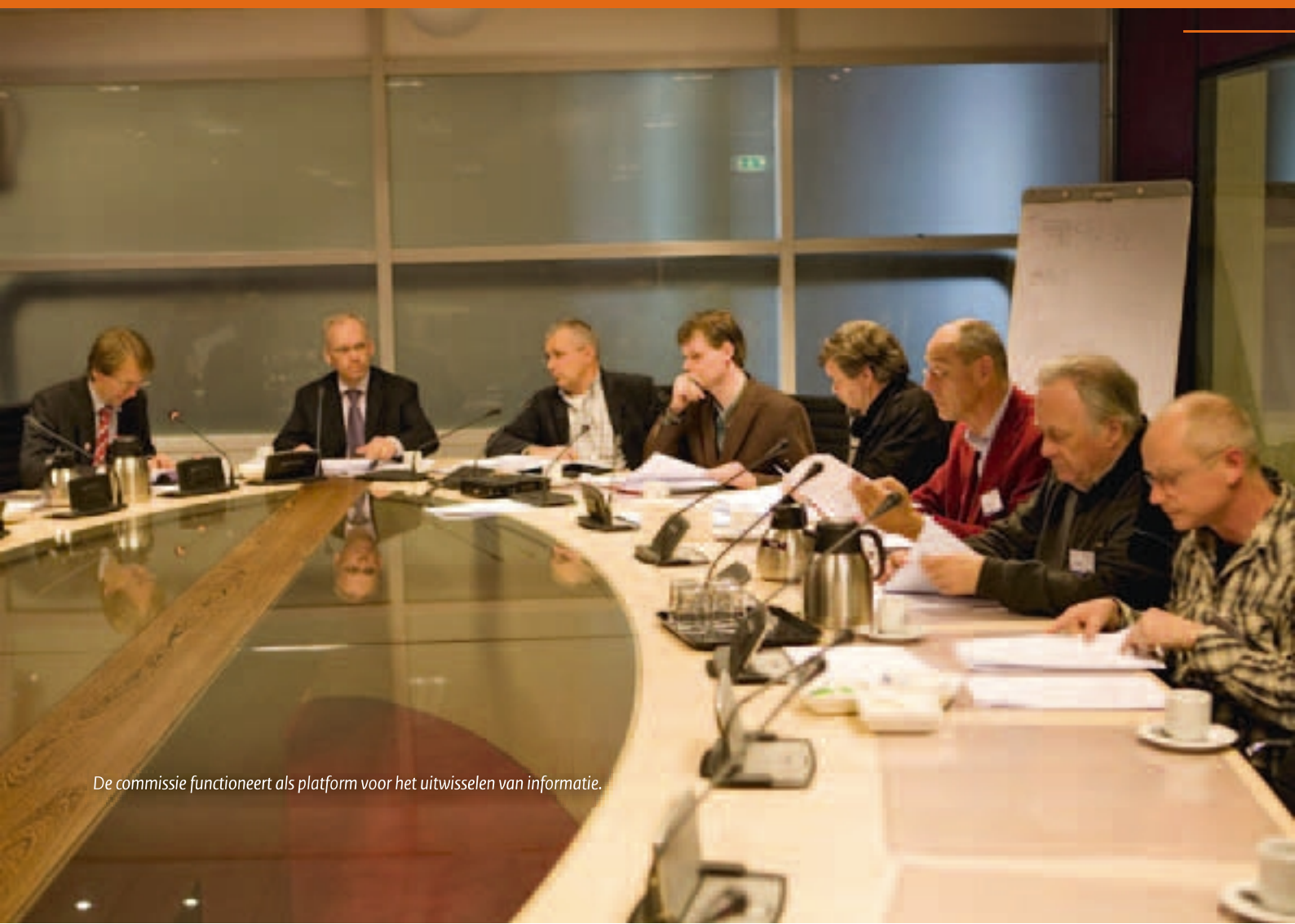
De commissie functioneert als platform voor het uitwisselen van informatie.