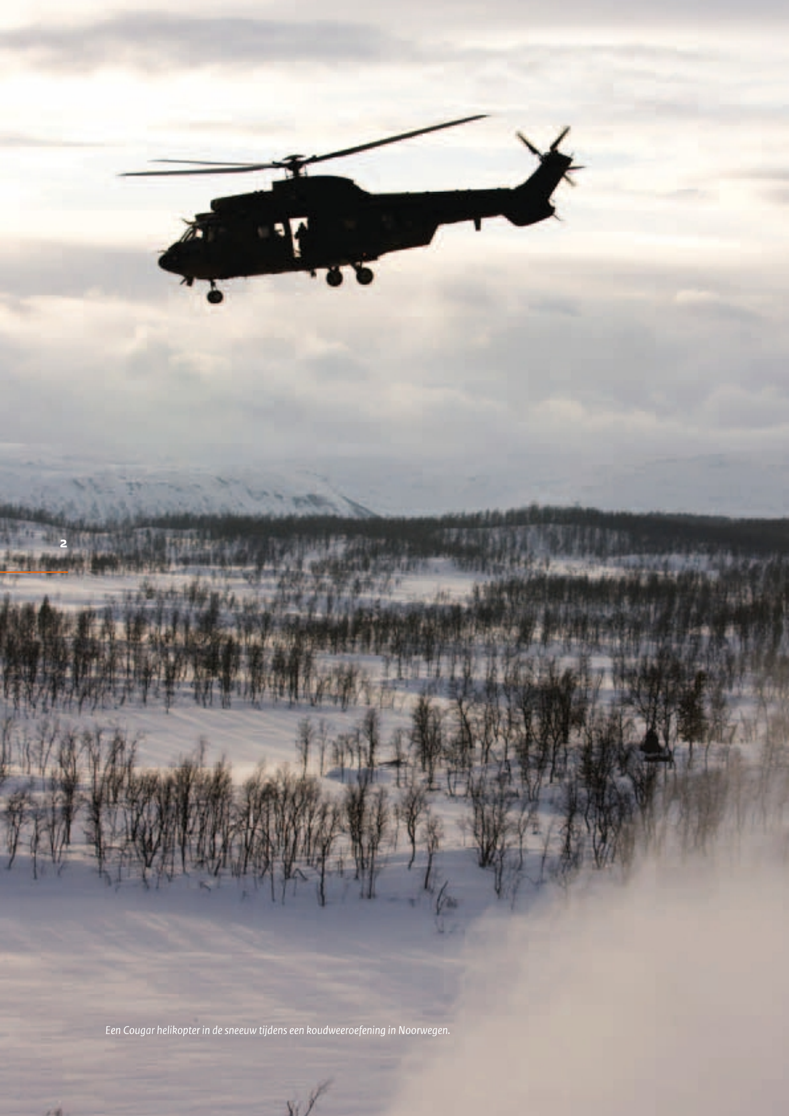
Een Cougar helikopter in de sneeuw tijdens een koudweeroefening in Noorwegen.