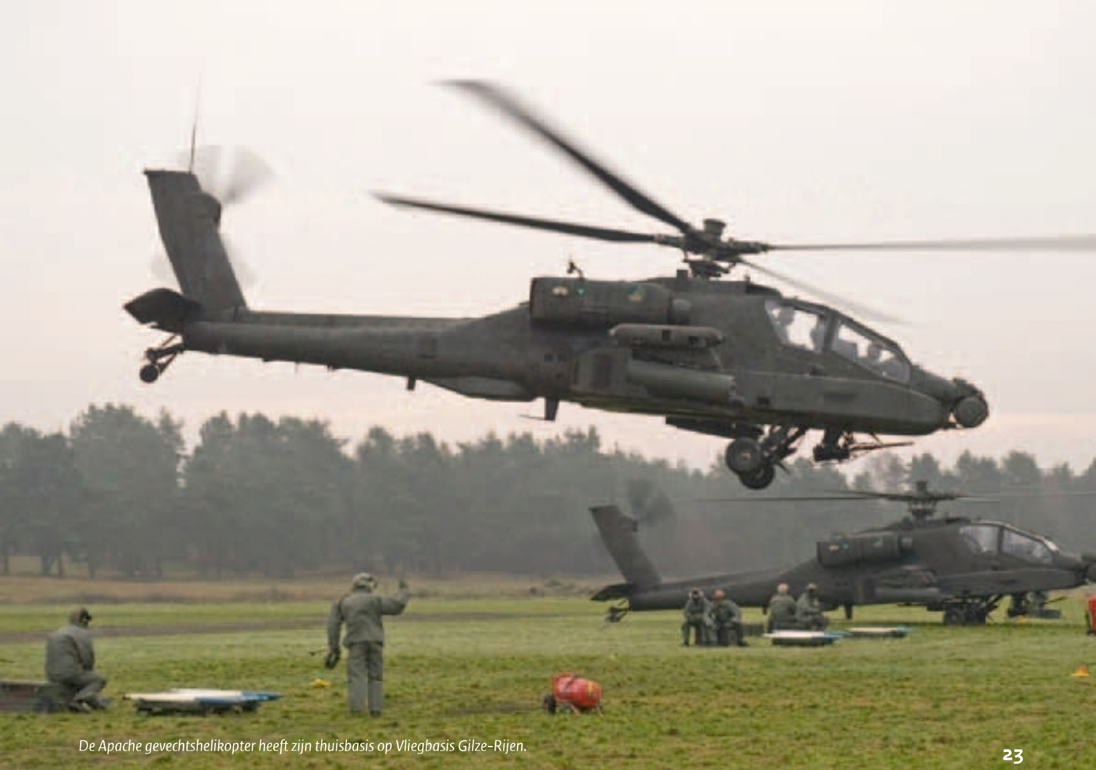
De Apache gevechtshelikopter heeft zijn thuisbasis op Vliegbasis Gilze-Rijen.