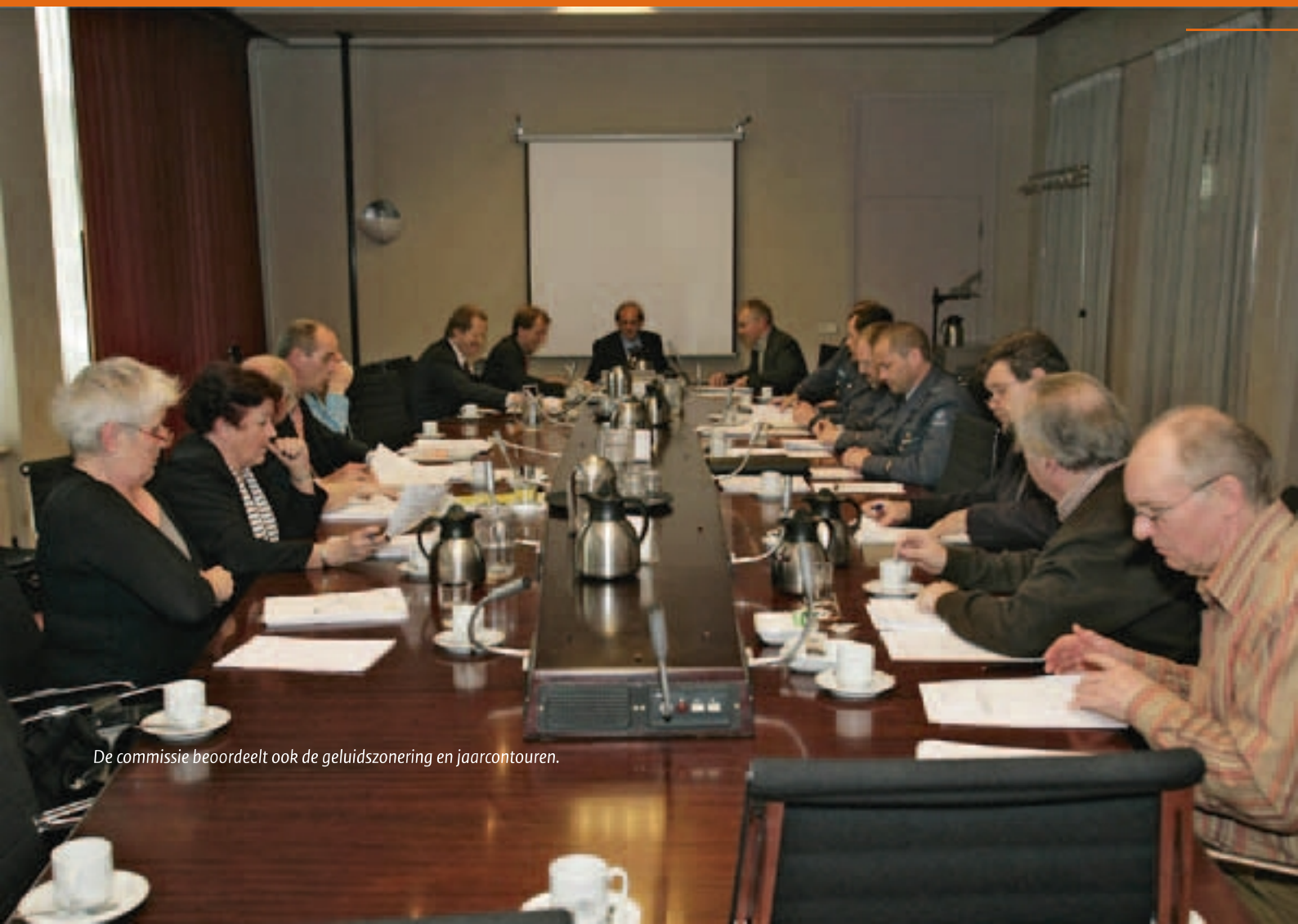
De commissie beoordeelt ook de geluidszonering en jaarcontouren.

Wilt u meer weten over bijvoorbeeld wet- en regelgeving, vliegprocedures of geluidzoneringsaspecten, dan kunt u informatie opvragen bij het secretariaat van de COVM van de betreffende vliegbasis of bij de gemeente waarin u woont. Uiteraard bestaat ook de mogelijkheid om contact op te nemen met vertegenwoordigers van uw gemeente in de COVM. Naam en adresgegevens staan per COVM vermeld in deze folder.